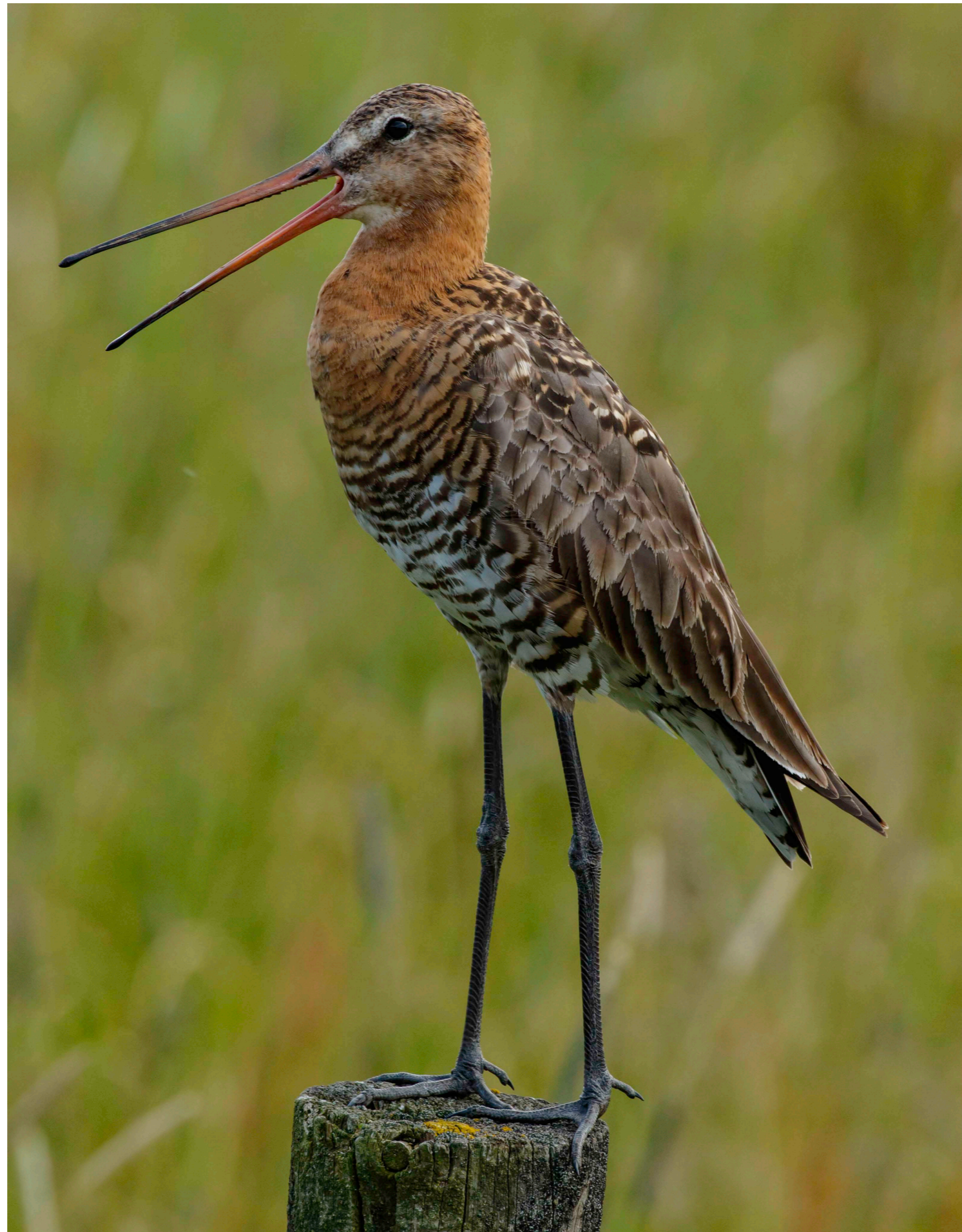
Rödspov, Svartåmynningens naturreservat

Naturvårdsverket har också ställt krav på att alla landets länsstyrelser senast nästa höst ska ha regionala handlingsplaner för grön infra-